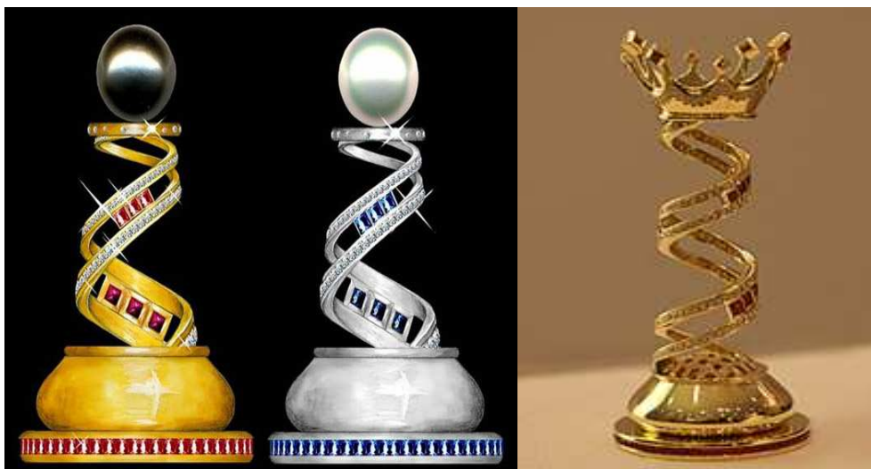
Najdroższe pionki świata (wraz z królem obok). Pytanie czy można nimi grać czy też pozostaje jedynie się zachwycać?

14. Najdroższy zestaw do gry w szachy wyprodukowała brytyjska firma Boodles. W zasadzie jest to niezwykle jubilerskie dzieło sztuki, w skład którego wchodzi złoto i platyna (jako elementy konstrukcji) oraz diamenty, szafir, rubiny i perły. Całość jest warta prawie 10 milionów dolarów.